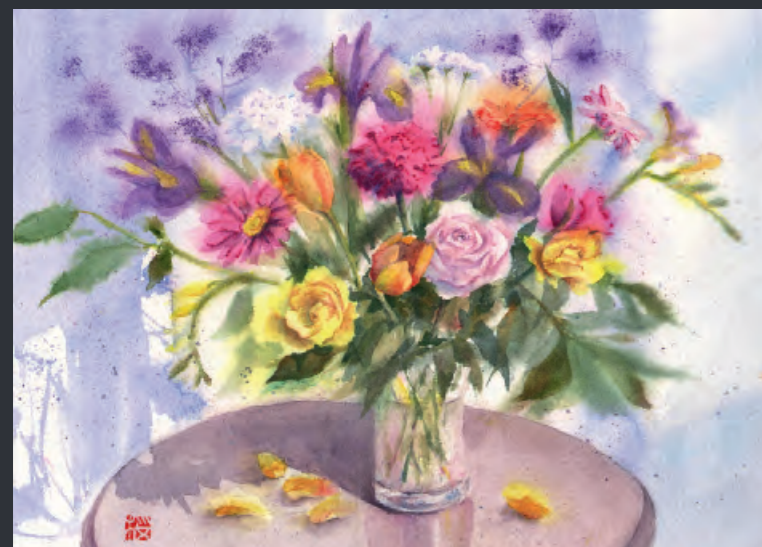
Sakura Misumi, England «Spring Bouquet» MUSEUM AQUARELLE

Nuancier - Farbkarte - Cartella colori - Carta de colores - カラーチャート